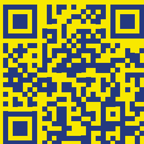
Faqja e aktualiteteve