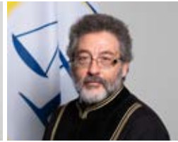
Gjykatës Zhilber Biti