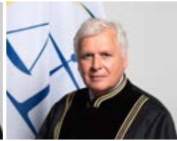
Gjykatës Roland Dekers