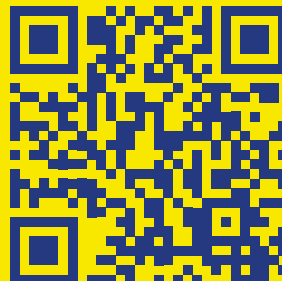
Kalendari i gjykatës